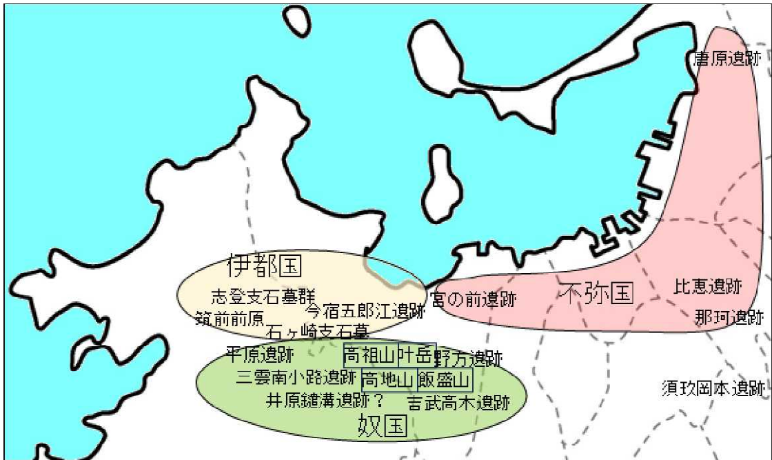
図4 伊都国・奴国・不弥国

これにより奴国は伊都国の南東と言えなくも無い事になり、また不弥国は伊都国の東となる。伊都国・奴国・不弥国の行路における方位に問題があるとの論説は根強く存在しているが、この図では三ヶ国の方位に関する問題はほぼ解消するようである。前原一平原遺跡の距離は唐津市一平原遺跡の距離の1/5よりも短い、前原一宮の前遺跡の距離は唐津市一平原遺跡の距離の1/5よりも多少長く、それぞれ百里程度と言う概算値を記録したのであろう。これで距離についても概ね問題は無さそうである。図4では須玖岡本遺跡(須玖遺跡群)がどの国にも属していない事になるが、これについては後で述べる。(続く)