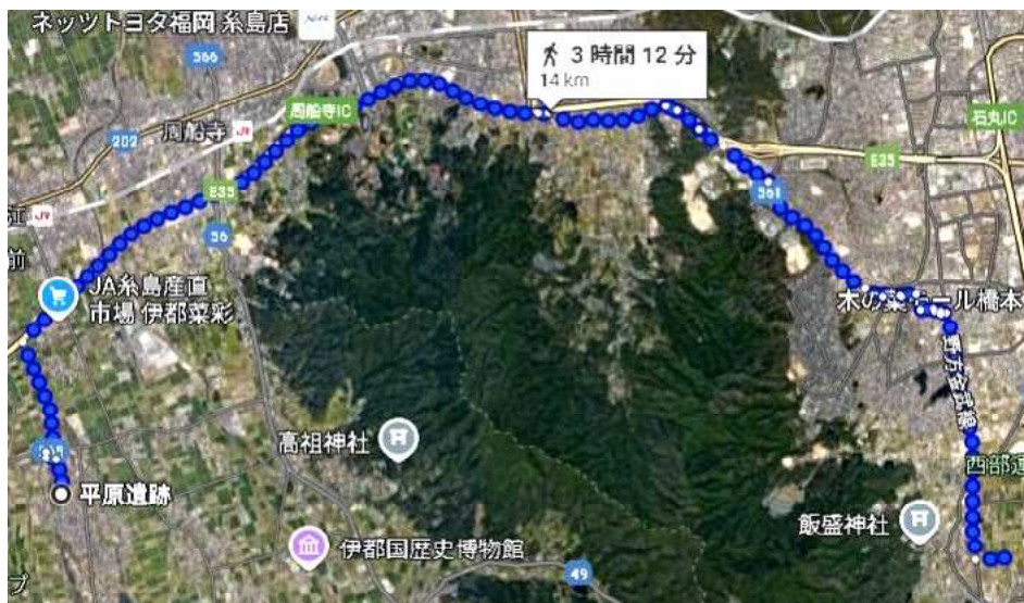
図 1 平原遺跡から吉武高木遺跡まで歩行

原田氏はクシフル山を天孫降臨神話の場と捉えており、また太陽信仰に関わるものと考えているが、いずれにせよ平原遺跡は高祖山等の連山との関連性を示しているように映る。標高はどれも 400m 程度なので徒歩での移動に支障は無く、また徒歩でそれぞれの山頂に至る事も可能で、